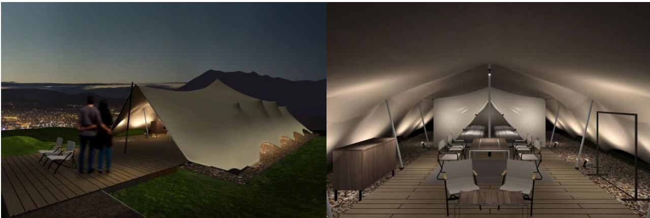
[客室詳細 - TENT]

スノーピークが YAKEI SUITE のために開発した特別仕様のテント「LAND CAVE ランド ケイヴ 」。キャンプ体験に近づけることを考えて設計されたテントでは、幕一枚越しに自然を感じる贅沢さを味わうことができます。