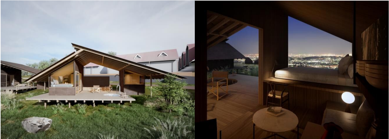
[客室詳細 - COTTAGE]

アウトドア・リビングでは、プライベートサウナで整い、大切な人とお食事を愉しむことができます。また、寝室の大きな窓ガラスから見える夜景を眺めながら眠りにつくことが出来るのもコテージの特徴です。